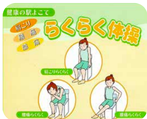
らくらく体操パンフレット