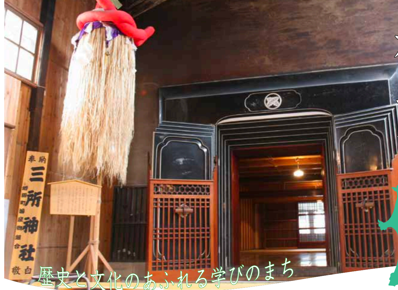
歴史と文化のあふれる学びのまち