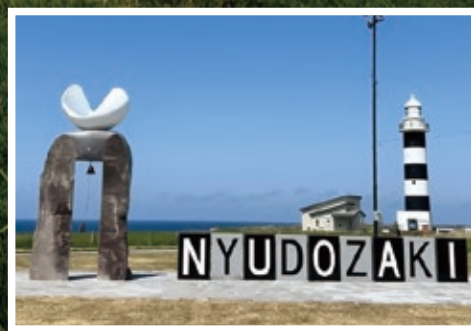
(写真：入道崎とモニュメント)