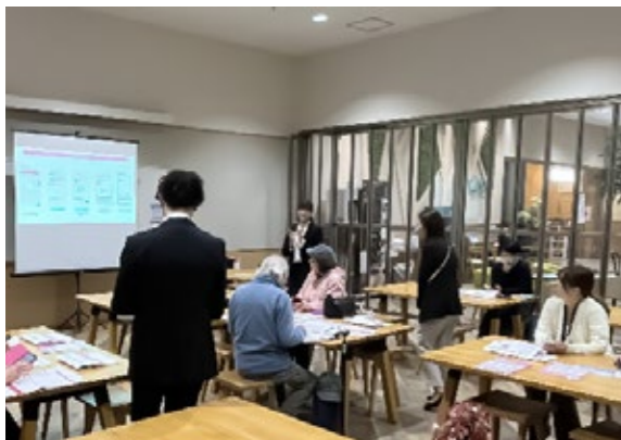
健康アプリ操作説明会

男鹿市は、日本海に突き出た男鹿半島の大部分を市域としています。男鹿半島の西北端の北緯40度線上に位置し、日本の灯台50選に選ばれた「入道崎」、芝生で覆われた山容と頂上から望む360度の風景を楽しむことができる「寒風山」などの貴重な地形は、国定公園や日本ジオパークに認定されています。豊かな自然や国指定の重要無形民俗文化財「男鹿のナマハゲ」、史跡「脇本城跡」など多くの文化や観光資源があります。