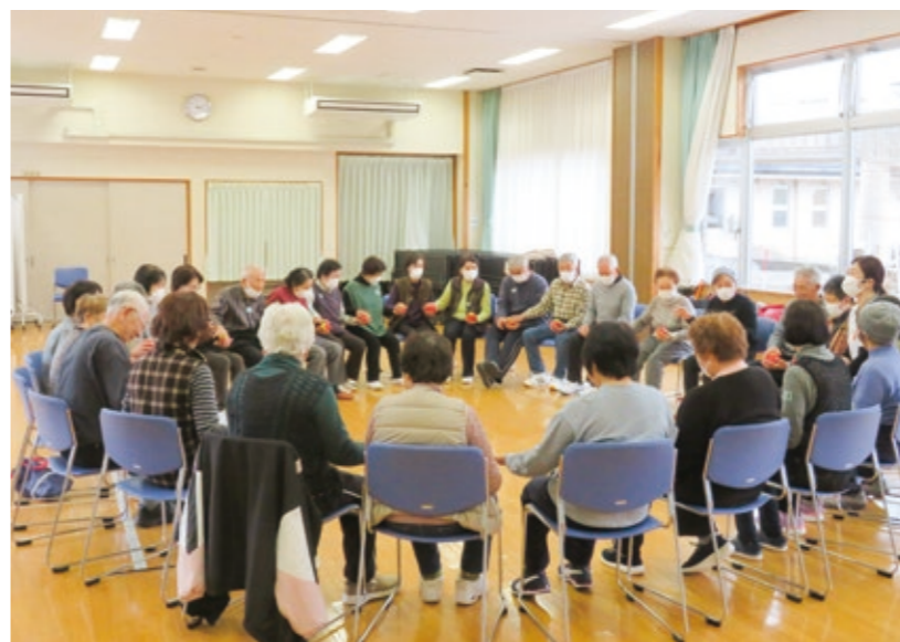
フレイル予防教室

2年間事業を実施し、新規に関わりを持たれた方はいるものの、人手不足もあり、その後のフォローアップが不十分であると感じたため、3年目の令和7年度はもともとあった介護予防教室を拡充し、