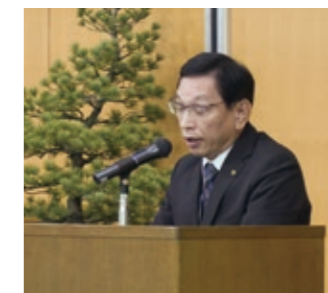
議長を務める備前東成瀬村長

局が令和8年度事業計画・歳入歳出予算について説明した。令和8年度事業計画については、「データヘルスを活用した予防・健康づくりや重症化予防等、保健事業を通じて保険者支援に努めるとともに、保険者努力支援制度においても、国により医療費適正化効果のある評価項目の重点化が図られていることから、第三者行為求償事務の受託や支援強化等、保険者による医療費適正化の取組に対する支援を引き続き推進する。」とした基本方針のほか、7つの重点目標である(1)国保制度の改善強化と国保事業安定化の推進、