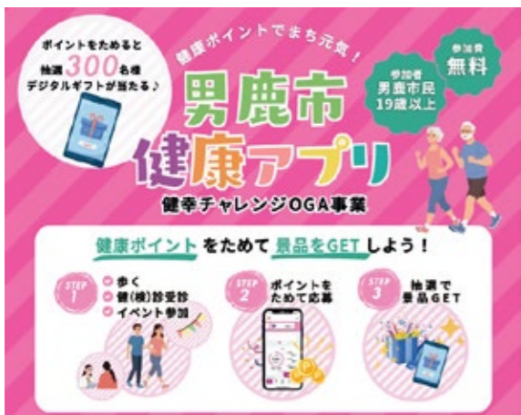
健康アプリのチラシ（一部）

募用紙を手書きする負担感、単なる記録にとどまり健康指標の改善効果が見えにくいなどの課題がありました。そこで令和7年11月に「男鹿市健康アプリ」を導入して、市民が健康意識を高め、健康的な生活習慣を実践・継続できる環境を整備し、新たに「健康チャレンジOGA事業」を開始しました。